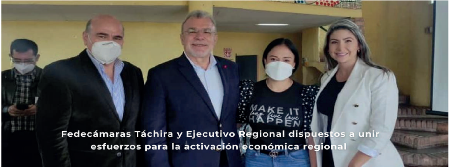
Fedecámaras Táchira y Ejecutivo Regional dispuestos a unir esfuerzos para la activación económica regional